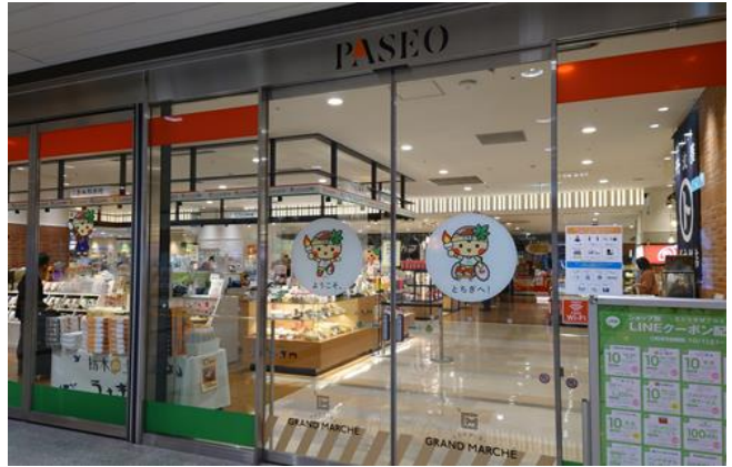
土産売場（宇都宮駅）