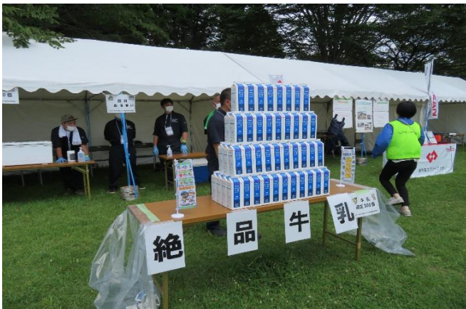
おもてなし・ふるまい