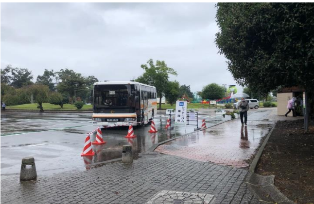
シャトルバス乗り場