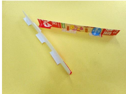
② 長方形に切った果汁パックに切り込みを入れて、写真のように折ります。