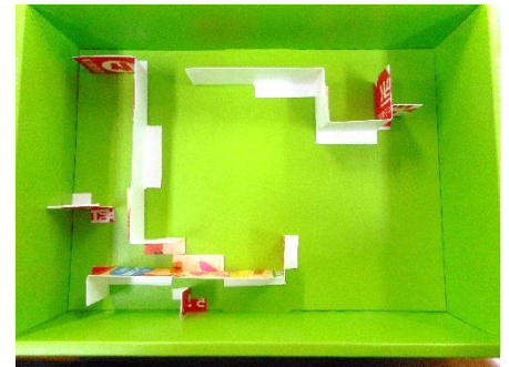
③ ②で作った仕切りを好きなように空き箱に貼り付けます。(どうしたら楽しい迷路になるかな?おうちの人と一緒に考えてみよう!)