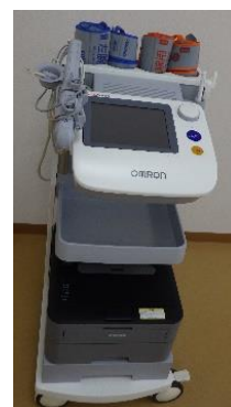
血圧脈波検査装置 (血管年齢) →