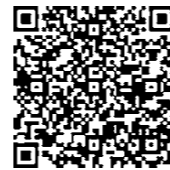
☑ 離乳食教室のお知らせ

◎感染症拡大予防の観点から、4か月、10か月児健診での「離乳食のお話」は中止しています。代わりに「オンライン型(Zoom)」と「来所型」の離乳食教室を開催しています。詳しくはこちらをご覧ください。