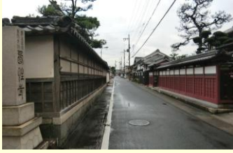
安土街道の風景(常楽寺)