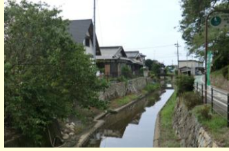
堀に石段を設けた風景(下豊浦)