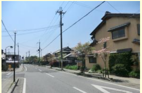
花木が彩る町なみ