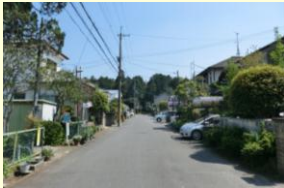
低層の住宅地と鎮守の森