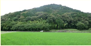
大地の記憶、 原風景を構成する 安土山と田園