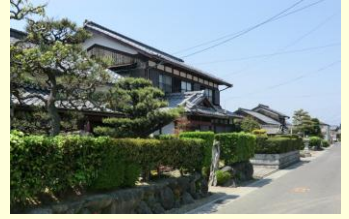
前庭が連続する風景(上豊浦)