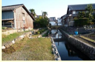
湊の面影を残す風景(常楽寺)