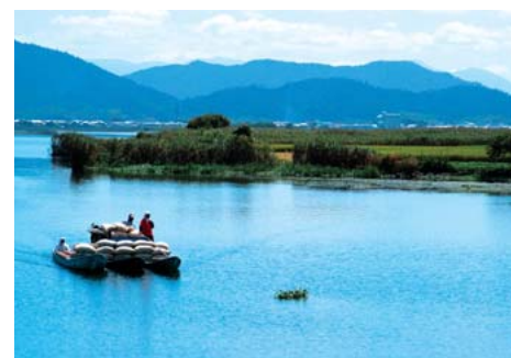
水郷地帯の稲の運搬