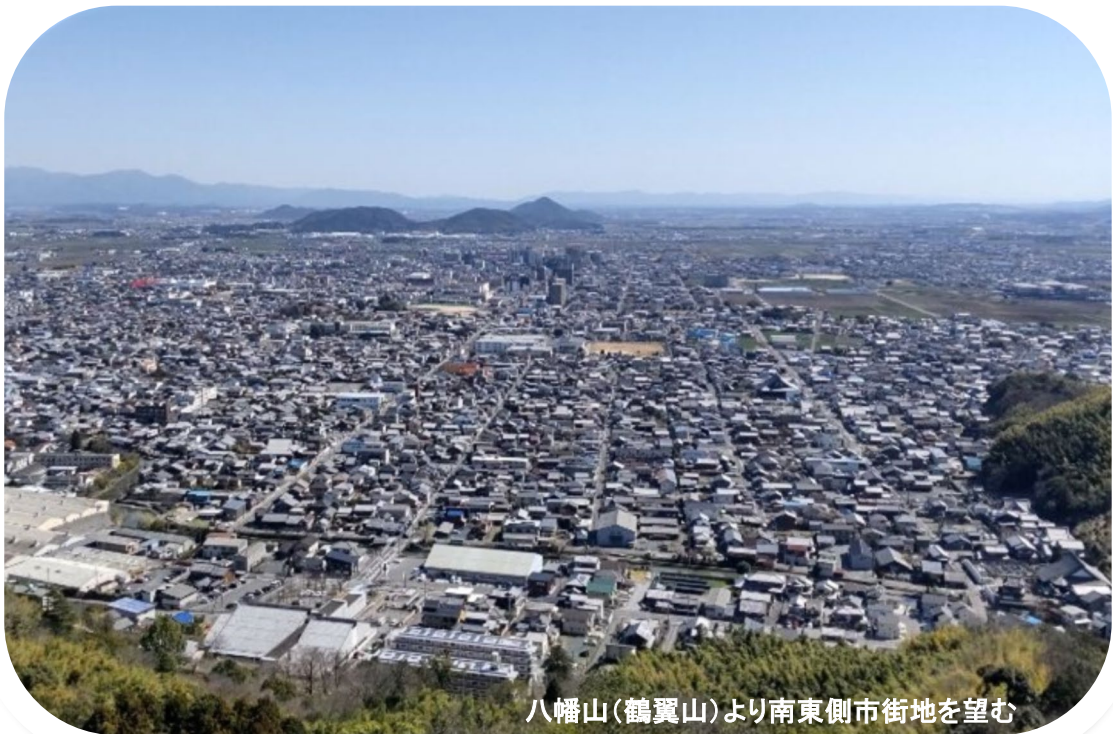
八幡山(鶴翼山)より南東側市街地を望む