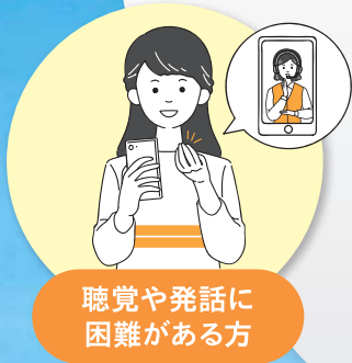
聴覚や発話に 困難がある方