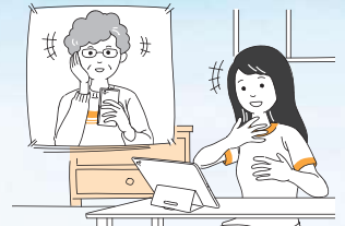
●家族や友人との会話