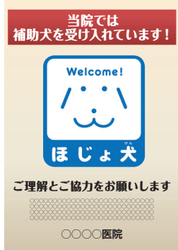
告知ポスターイメージ