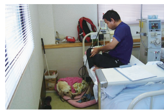
透析室では、透析が終わるまで盲導犬はベッドの横でおとなしく待機。

現在は2代目の盲導犬を同伴されていますが、1代目同様、院内のアイドル的存在になっています。