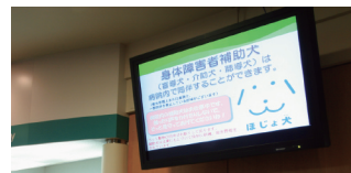
外来の待合室では、ほじょ犬の同伴について、モニターで情報発信。（市民総合医療センター）