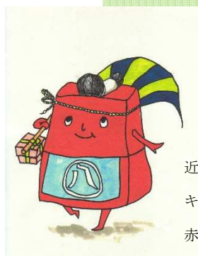
近江八幡市 キャラクター 赤コン君