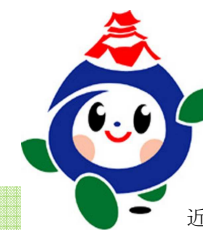
近江八幡市 キャラクター あぶっち