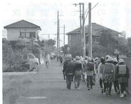
【桐原学区 子ども達の通学の様子】