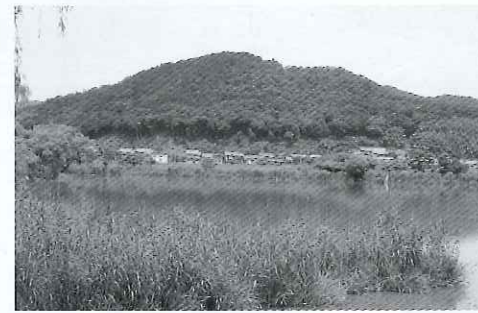
【西の湖から望む農村風景】

性を活かした魅力あるまちづくりの推進を図るため「市農村振興計画」を策定し農業振興に努めています。農村集落を守るには、単に農地を残せば良いというだけではなく、様々な地域の活動に積極的に参加してもらえ、住民をも地域の外から呼び込むことが必要であると考えます。