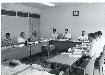
【産業建設常任委員会】

審査終了後には、6次産業と農商工連携、及び空き家対策について、閉会中の継続審査に付する所管事務調査項目として議決し、今後閉会中も調査や視察研修などを行いながら、市政発展のため取り組んでまいります。