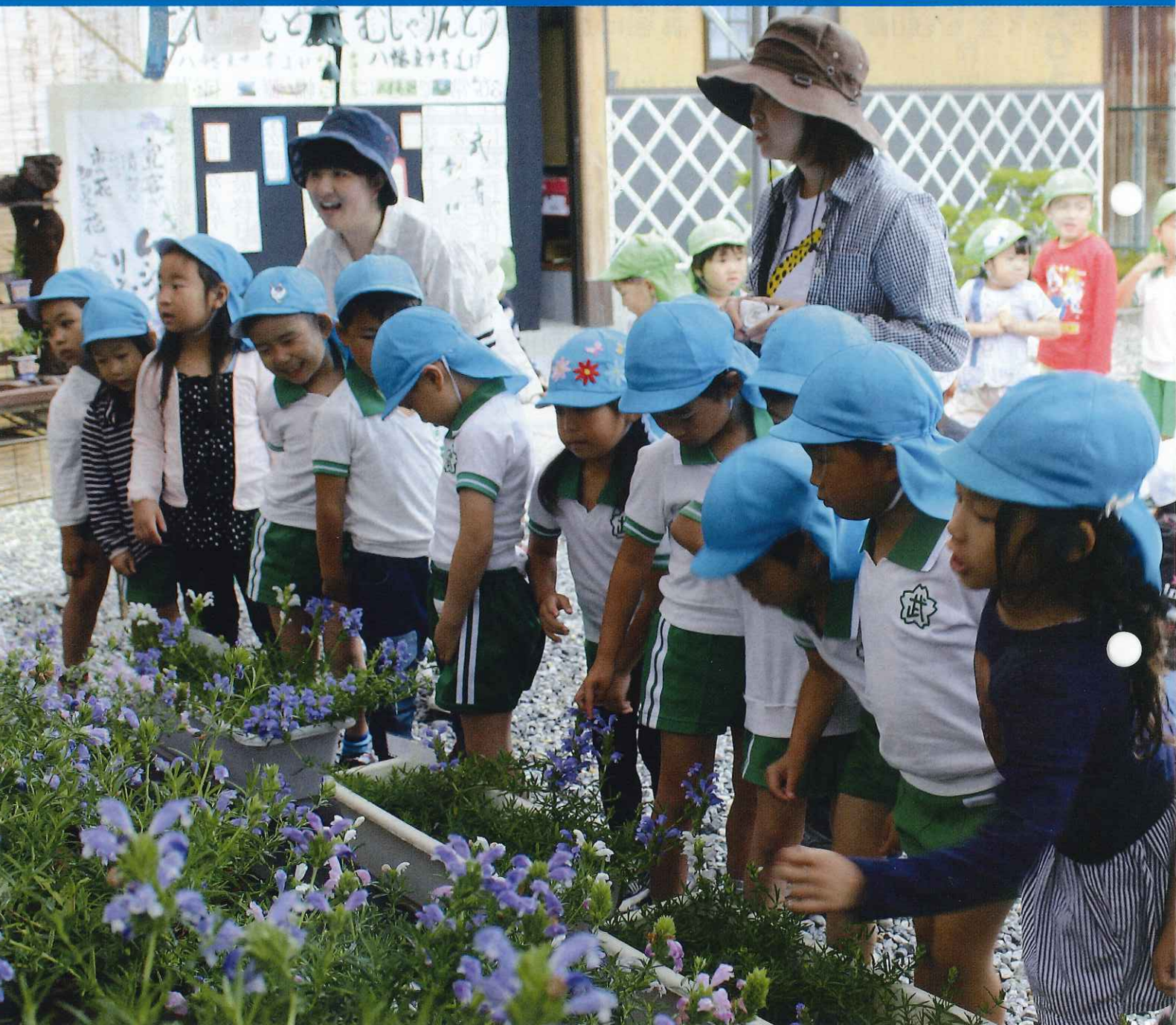
【むしゃりんどう展】

編集：議会だより編集委員会 発行：近江八幡市議会（年4回発行）〒523-8501 滋賀県近江八幡市桜宮町236 TEL 0748 (36) 5528 FAX 0748 (36) 7101 ホームページアドレス http://www.city.omihachiman.shiga.jp/ Eメール 020200@city.omihachiman.lg.jp