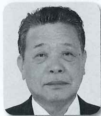
豊年橋付近の通学路対策について