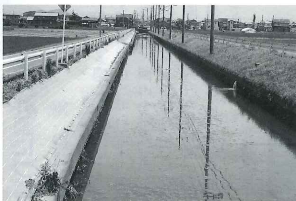
【生活排水等が流入する承水溝】

1点目の流量は、上流部の用途変更により造成当時より増加していると考えられます。2点目の管理は、現在は土地改良区が行っていますが、限界に来ていられると思います。3点目の実施事業は、維持管理適正化事業として浚渫工事を実施し、流下