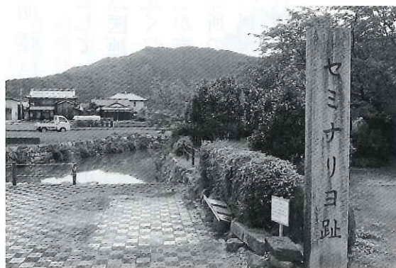
【整備されるセミナリヨ史跡】

本事業は、平成26年度からの5カ年計画により歴史的資産の早期活用観点から、賑わいのある7つの拠点整備を行います。平成27年度はセミナリヨ史跡公園周辺を安土お堀めぐりの船着場等としての利活用を視野に入れ整備いたします。拠点整備のハード面が注目されがちですが、