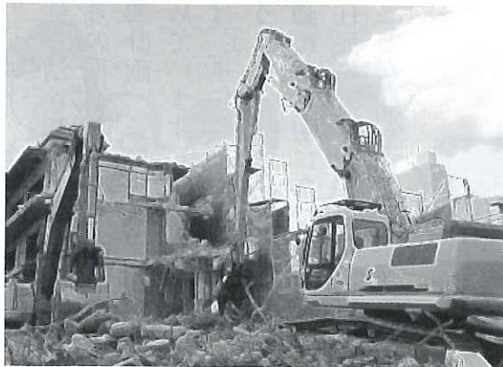
【解体工事のイメージ】

につきましては、現在裁判で係争中に係る案件でありますので、この場での回答は控えさせていただきます。本件裁判確定後、当該事業に係る総括を行い、厳正かつ適正な対応を行います。