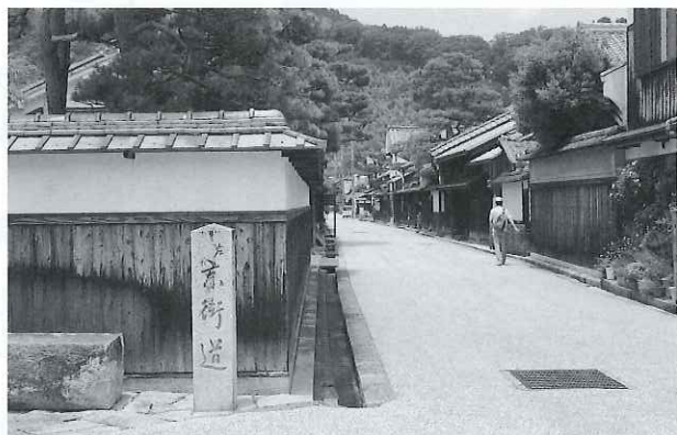
【観光地でもある旧市街】

また、八幡堀等周辺の交通渋滞・安全対策については従来の交通規制期間に合わせ、警備員