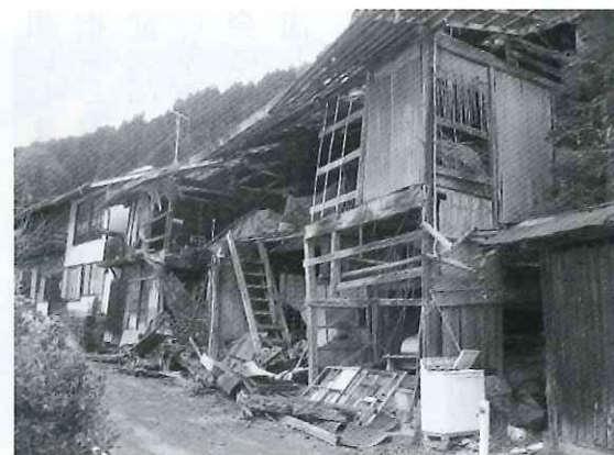
【全国的に進む空き家】

空き家問題については、緊急かつ重要な課題と認識しております。また、本年5月に空き家対策の推進に関する特別措置法が全面施行したことにより、情報の共有化を目的とした第1回の庁内調整会議を実施したところで