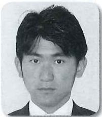
まち・ひと・しごと創生総合戦略について