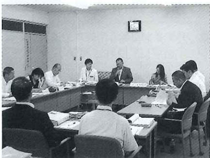
【教育厚生常任委員会】

なお、閉会中におきましても、学校・園に関すること、福祉施設に関することにつきましては継続審議とし、積極的に研修等を行いながら、活発な常任委員会の運営に努めさせていただきます。