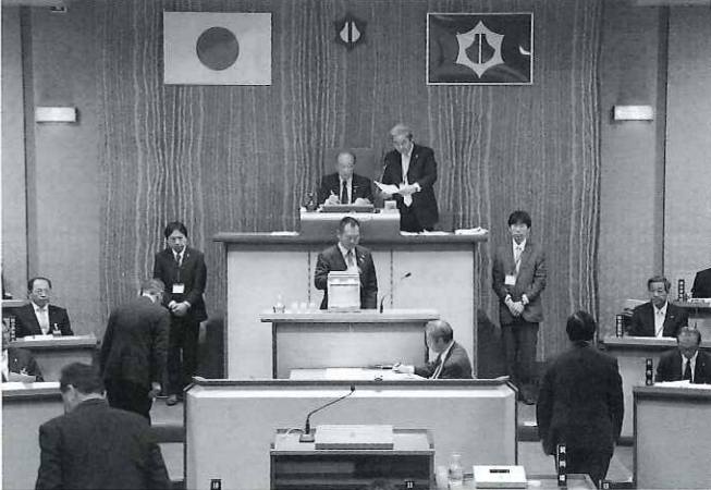
【正副議長選挙の様子】