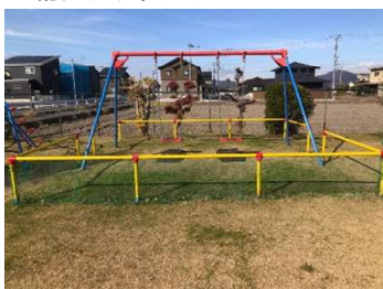
【二人乗りブランコ及び安全柵】