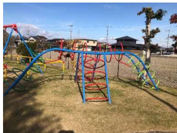
【ハングリング(リングラダー)】