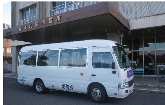
車外②広告掲載（ドア部分）16人乗車