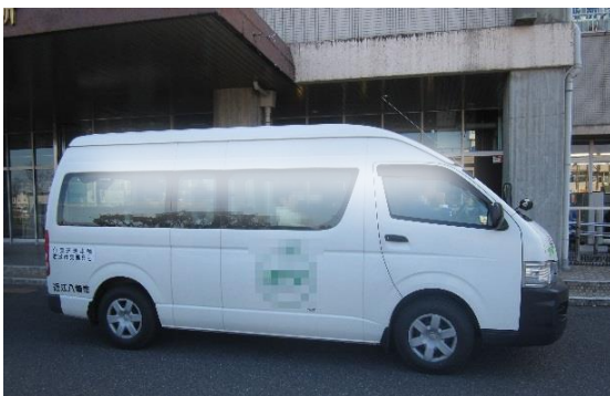
車外①広告掲載（ドア部分）12人乗車