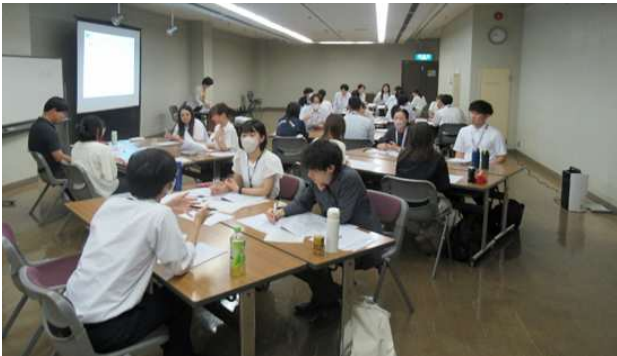
キャリアデザイン研修の様子