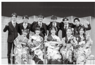
令和8年成人式実行委員

20歳の門出を祝う成人式の実行委員を募集します。一生に一度の思い出に残る成人式を自分たちの手で創り上げてみませんか。友人や知人を誘っての参加も大歓迎です。