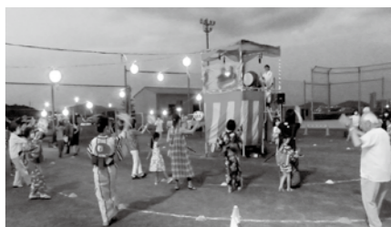
▲7月に開催した納涼フェスティバル