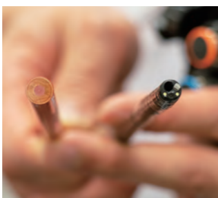
鉛筆(左、7mm)より細い経鼻胃カメラ(右、5mm)は挿入時のえづきやのどの違和感をあまり感じずに検査ができます。

Q 内視鏡検査ってしんどいって聞いたけど？ 確かに楽に受けることができる検査ではありません。したがって、当センターではできるだけ楽に受けていただけるようにさまざまな工夫をしています。治療だけではなく、それぞれの検査には必ず看護師がひとりずつついてサポートをします。胃カメラについては、鼻から行うと比較的えづきも少なく楽に検査がで