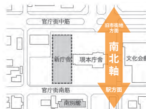
新庁舎配置場所のイメージ図 ※庁舎の形や大きさを決定したものではありません。

※1. ( )内の金額は、減額していない場合の金額です。 ※2. 新型コロナウイルス感染症に関する支援策の財源の一部に充てるため、市長・副市長・教育長の6月期末手当の支給はありません。また、議長・副議長・議員の報酬は7月～9月まで10%削減しました。