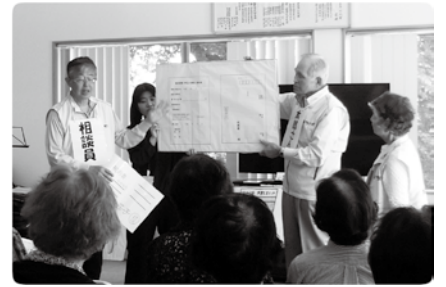
消費生活出前講座に ぜひお申し込みください

消費生活センターまで相談ください。また消費生活出前講座では地域の自治会、老人会、ふれあいサロンなどに出向き、市内の相談事例を寸劇などで紹介し、勧誘の断り方など実践を交えた内容で行っています。子ども向けには、お金の使い方などをテーマに楽しく学んでもらえる内容で行っています。昨年度は市内で37回開催し、参加人数は1,000人を超えています。皆さんからの申し込みをお待ちしています。