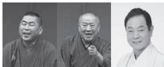
桂南光 桂ざこば 月亭八方

開館以来続いている恒例の落語会。新年の門出を上方落語でお楽しみください。 好評発売中