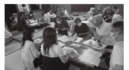
見守りマップを使った話し合い(加茂町)

いの和」も月1回発行し、活動の周知を図っています。 このように自治会では地域の困りごとを住民が情報共有し、お互いが支え合い、住みやすい地域づくりに取り組んでいます。