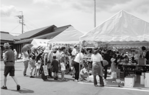
地域住民でにぎわう夏祭り(平成30年度開催)

ここ数年、コロナ禍でイベントや行事の形態が変わりつつありますが、企画者側として参画するなど、地域住民のひとりとして、ぜひイベントや行事に参加してみたいかがでしょうか。