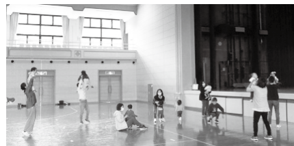
アリーナの広い空間で、澄んだピアノの音色と歌声にあわせて親子で身体を動かしましょう。