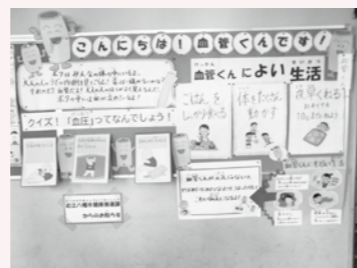
廊下の掲示物。来校する保護者にもご覧いただきました。