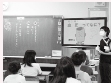
授業では、健康推進課オリジナルキャラクター「血管くん」が血圧についてわかりやすく説明しました。