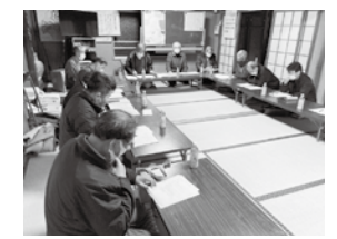
自治会でされている会議

春が近づくと、多くの自治会では総会を開催し、1年間の活動を振り返り、新年度の事業やお金の使い方、役員などを決めていきます。総会は、自治会運営の最重要会議として位置付けられ、会員が意見を述べられる機会にもなっています。また、総会に参加できなくても、その内容を掲示板や回覧板でお知らせしている自治会もあるため、こうした機会に1年間の自治会活動を確認してみましょう。