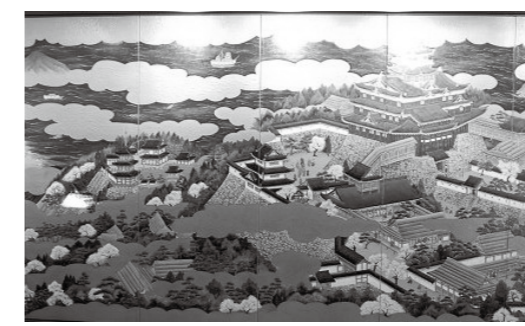
安土城屏風絵陶板壁画 画:宇田妙子(安土城郭資料館所蔵)

・暗いところで光るシール/10枚 ※費用無料、追加は実費負担。 地域の皆さんへ シールを付けた人を見かけたら ①ご本人の正面からやさしく声をかけてください。 ②スマートフォンで二次元コードを読み取ってください。 ③保護時の注意点が表示されます。 ④伝言板サイトへ位置情報や本人の状況を入力してください。 ※家族と直接、24時間365日連絡ができます。発見者ご家族は、個人情報を入力することなくやりとりできます。