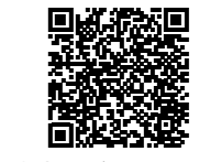
水害ハザードマップ(GIS版)

でき、家族内での会議や防災学習など、多くの場面で活用いただけます。左記二次元コードからご覧いただき、いざという時に備えましょう。