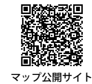
マップ公開サイト

本市では、地図情報を利用した都市計画情報などの行政情報を「近江八幡市マップ公開サイト」として公開しており、市民の皆さんが安全で確実な避難行動が取れるよう、減災対策の取り組みとして、「近江八幡市水害ハザードマップ(GIS版)」を公開しています。ハザードマップでは、市内の危険箇所や指定避難所を確認することが