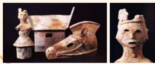
■供養塚古墳出土埴輪 (安土城考古博物館に常設展示)

JR「近江八幡駅」・近江鉄道「近江八幡駅」より ◎車で5分 ◎バスに乗換「六枚橋」または「長福寺」下車