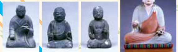
■椿神社神像(栗東歴史民族博物館へ寄託)