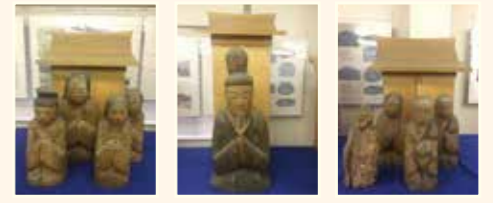
■馬見岡神社神像(琵琶湖文化館へ寄託)