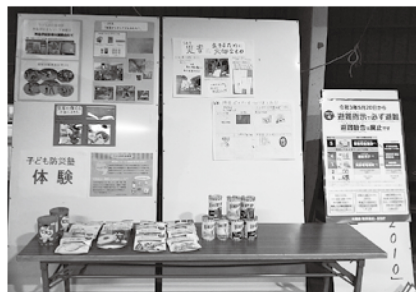
子ども防災塾のパネル展示

湖に囲まれた沖島にとって、災害時の対応は大きな課題です。沖島学区の皆さんが、より安心して暮らせる環境を一緒に作って行けるよう、当協議会ではさまざまな事業をこれからも実施していきます。