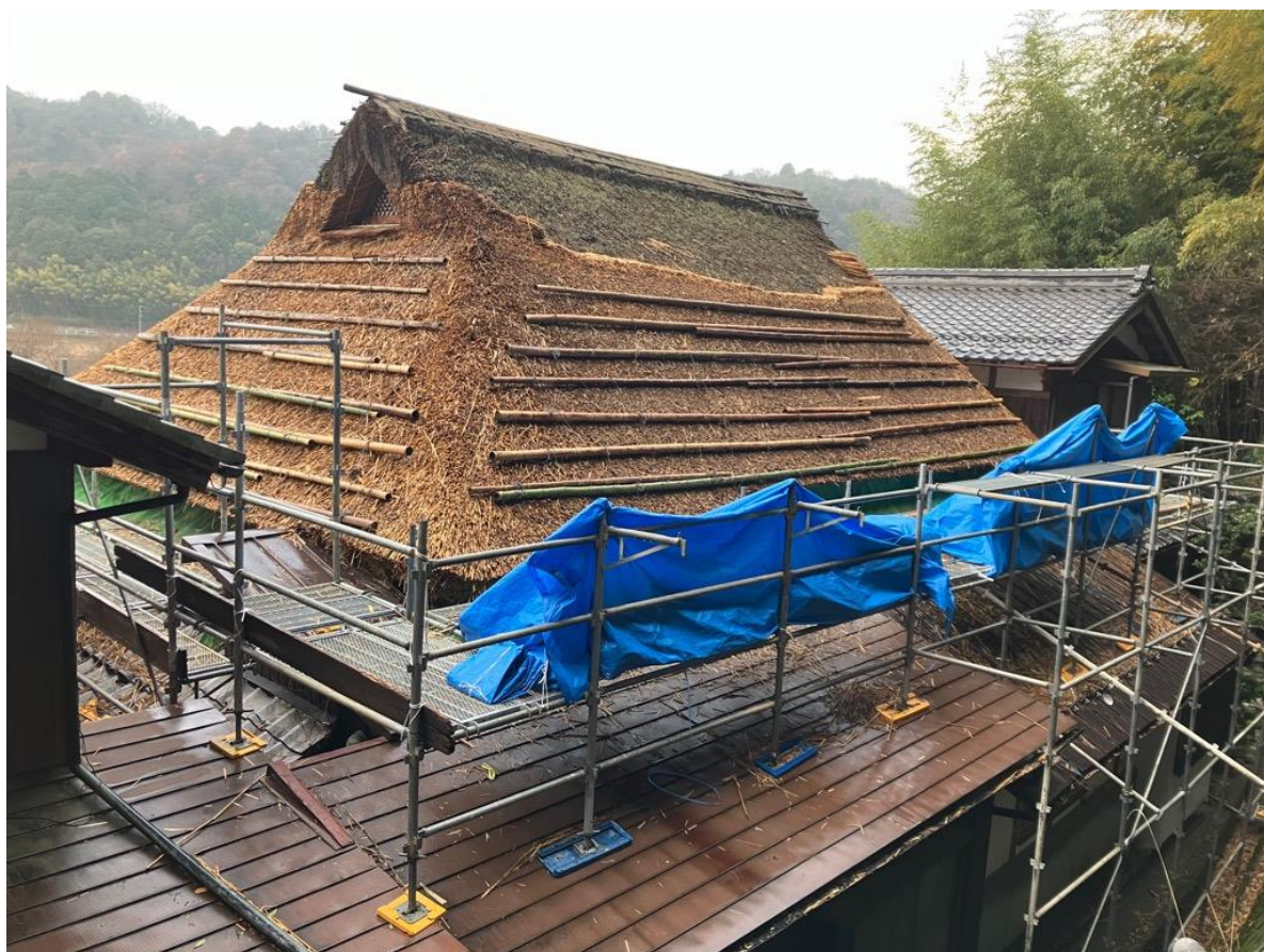
修理中の清見寺本堂