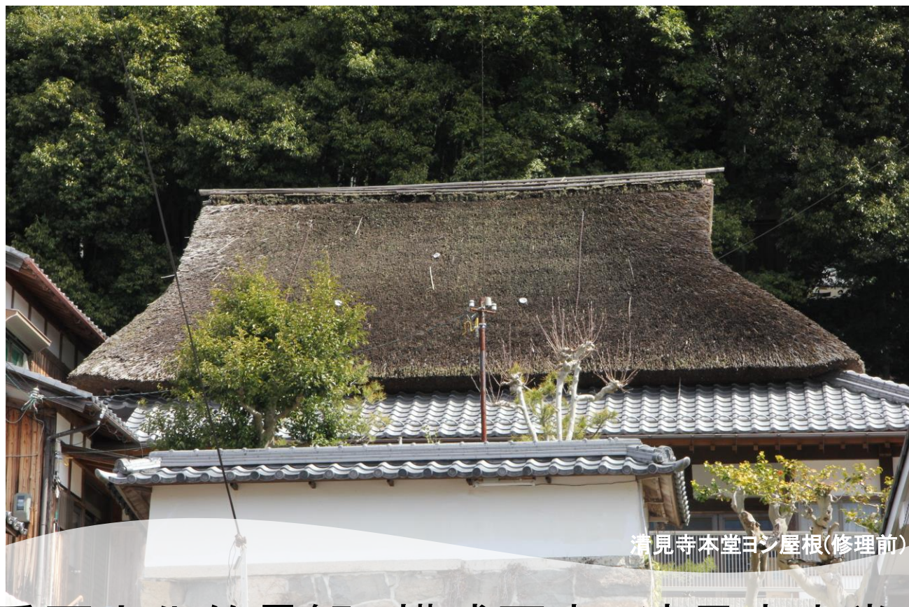
清見寺本堂ヨシ屋根(修理前)